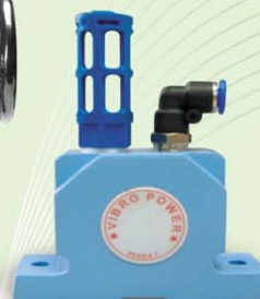
ไวเบรเตอร์ Vibrotor