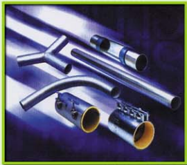
ท่อน, ข้องอ และคัปปลิง Pipe, Pipe Bend, Coupling