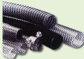
ท่อนอ่อน Flexible Hose