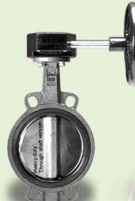
บัตเตอร์ฟลายวาล์ว Butterfly Valve