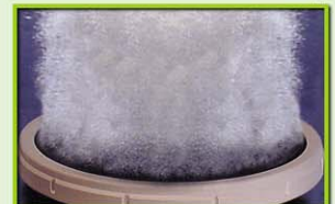
นั้วจ้ำงอากาศ Disc Diffuser